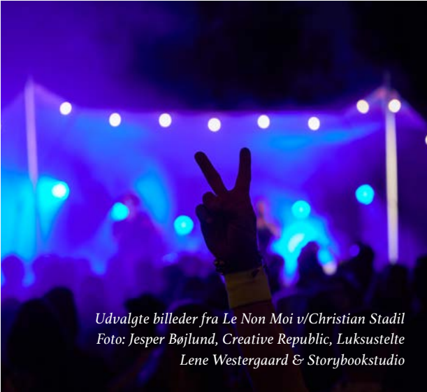
Udvalgte billeder fra Le Non Moi v/Christian Stadil